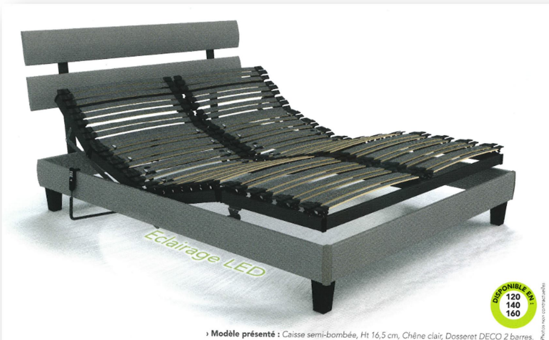
» Modèle présenté : Caisse semi-bombée, Ht 16,5 cm, Chêne clair, Dossieret DECO 2 barres.